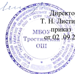
График проведения оценочных процедур на 2024-2025 учебный год для учащихся 1-4 классов